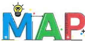
Místní akční plán ORP Rakovník II

Nepodařilo se zatím úplně efektivně nastartovat chod skupiny lídrů/expertů, která není v tomto sledovaném období ještě plně obsazena. Nedaří se obsadit pozici lídra za digitální gramotnost. Rozvoj digitální gramotnosti je zatím vnímán pedagogy poněkud vlažně, přisuzujeme to jejich obavám z něčeho nového a neznámého. Rozvoj digitální gramotnosti je jimi vesměs chápán jen jako záležitost týkající se učitelů informační technologie a nikoliv všech. Rozvoj gramotností není zatím brán jako celek ČG/MG/DG.