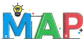
Místní akční plán ORP Rakovník II

Podstatná část členů ŘV byla zapojena v ŘV předchozího projektu MAP I. ŘV je složen z odborníků, které spojuje jeden z hlavních cílů MAP, a to snaha o zvyšování kvality vzdělávání na území ORP Rakovník. Diskuse členů ŘV je díky jejich zkušenostem, praxi s předchozím projektem a odbornosti, na vysoké úrovni a jednání tak probíhají efektivně.