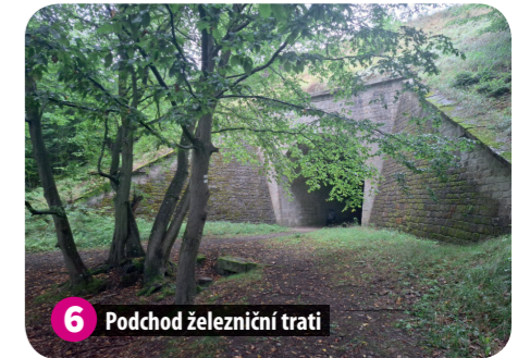
6 Podchod železniční trati