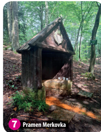
7 Pramen Merkovka