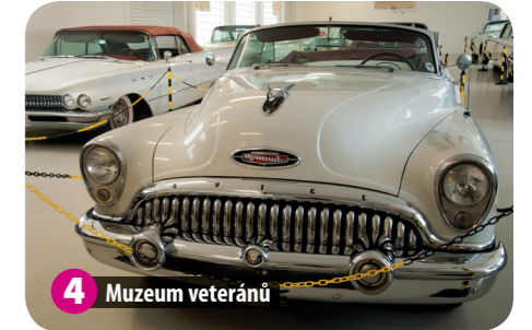
4 Muzeum veteránů