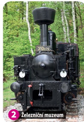
2 Železniční muzeum