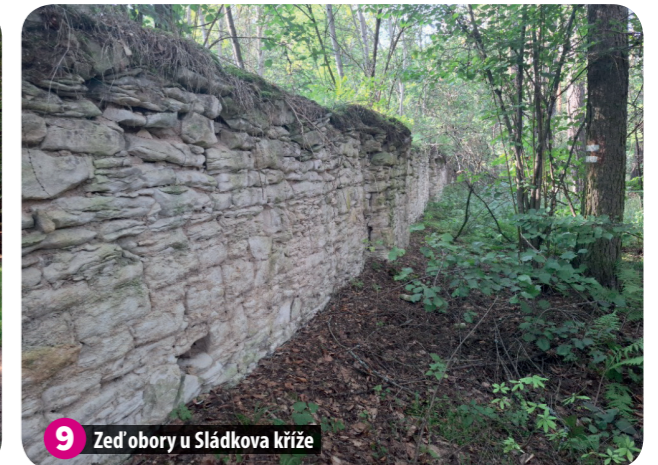
9 Zeď obory u Sládkova kříže

Výstup „Zvědavá stezka Lužná“ byl vytvořen v rámci projektu: „Místní akční plán ORP Rakovník IV“, reg. č. CZ.02.02.XX/00/23_017/0008300. Tento výstup lze užit v souladu s licenčními podmínkami Creative Commons BY-SA 4.0 ( https://creativecommons.org/licenses/by-sa/4.0/ ).