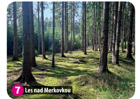
7 Les nad Merkovkou