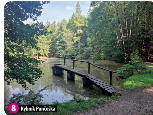
8 Rybník Punčoška