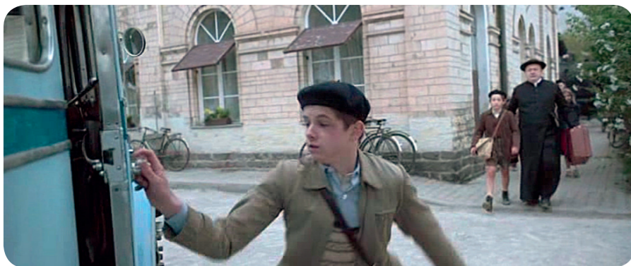
Záběr z filmu „Z Paříže do Paříže“

ZAJÍMAVOST / ÚKOL Nádraží v Lužné ti může být povědomé, i když jsi tu třeba nikdy nebyl. Mohlo by to být tím, že jsi ho viděl v některém filmu nebo televizním seriálu. Natačelo se jich tady několik, například filmy Jan Palach, Po strništi bos, detektivka s proslulým komisařem Maigretem „Vražda v kupé první třídy“ nebo adaptace slavného románu „Z Paříže do Paříže“, který se odehrává za druhé světové války a vypráví o nebezpečném útěku dvou statečných chlapců - židovských bratrů z nacisty okupovaného hlavního města Francie. Příložený záběr pochází právě z tohoto napínavého a dojemného filmu. Najdi místo na luženském nádraží, které toto filmové okénko zachycuje! A třeba se pak na stejném místě i vyfoť na památku a tvař se přitom jako filmová hvězda!